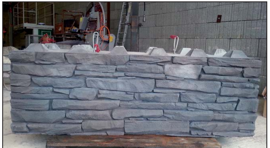
Rastersteine mit Bruchstein-Optik: Abmessungen

Auf Kundenwunsch ist der Abschlussstein auch ohne Noppen möglich, sowie die Seiten in Bruchstein Optik.